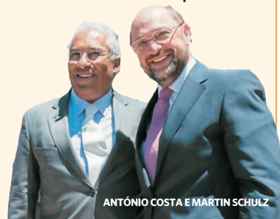
ANTÓNIO COSTA E MARTIN SCHULZ

Obedecer à Alemanha, caminho de declínio