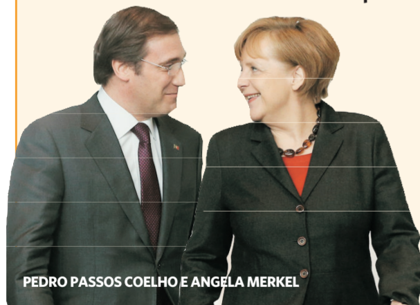
PEDRO PASSOS COELHO E ANGELA MERKEL

Votar na direita é continuar a empobrecer.