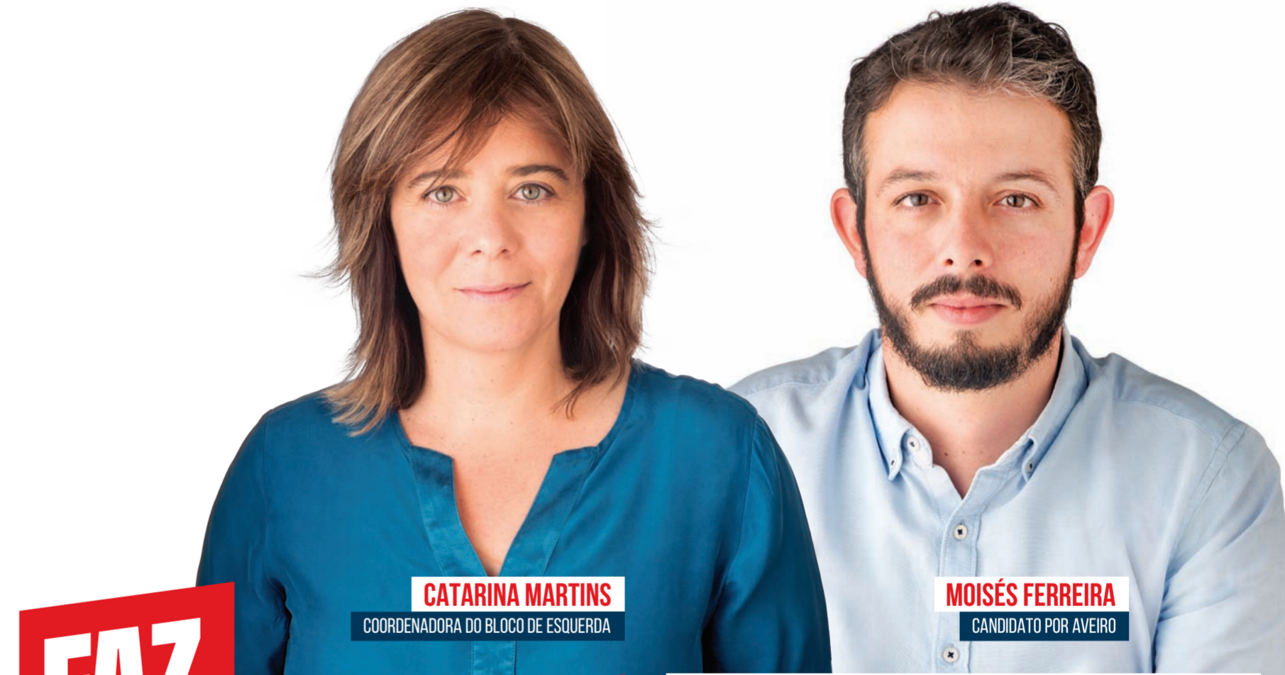
CATARINA MARTINS COORDENADORA DO BLOCO DE ESQUERDA